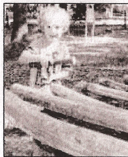
Früh übt sich, was ein echter Baumxylophon-Spieler werden will...

stellt, das Obst stammt von der eigenen Apfelbaumwiese. Eins der neuesten Projekte: Nach und nach werden für die Tiergehege schön gestaltete Infoschilder angeschafft. Die Tafeln sind