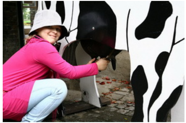
Am Modell konnten man trainieren, wie gemolken wird