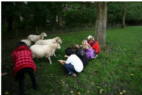
. . . konnten wir zu den Nutztieren, um sie zu füttern