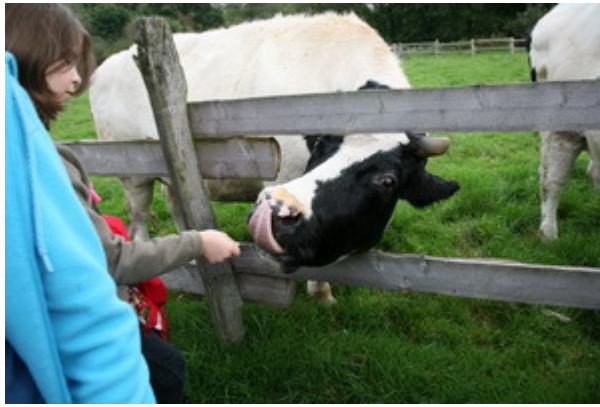
Also fingen wir auch an, die Kühe zu füttern