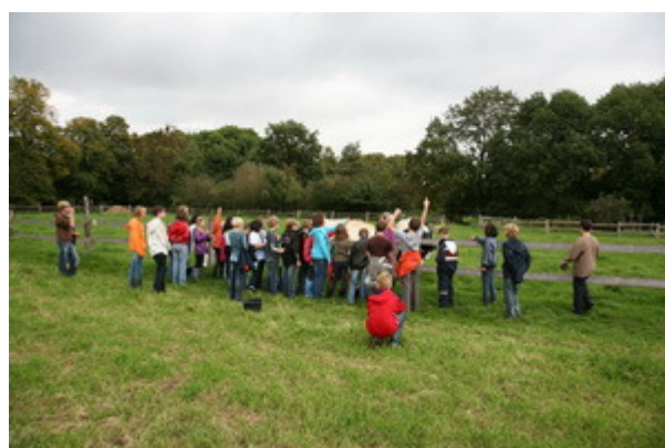
Jeder konnte ihr immer Fragen stellen