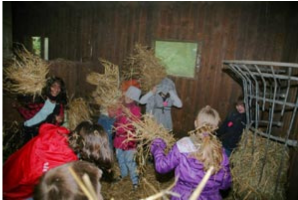
. . . zur Strohschlacht