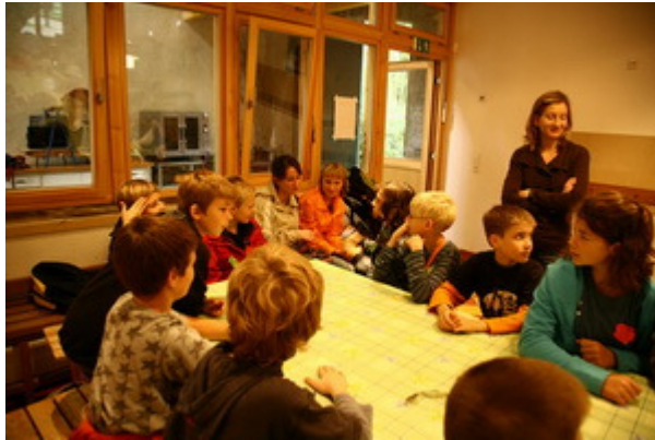
Nach all diesen Aktivitäten hatten wir alle großen Hunger ...