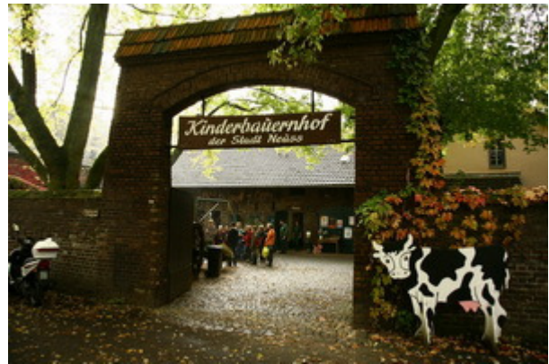
Auf dem Kinderbauernhof wurden wir schon erwartet