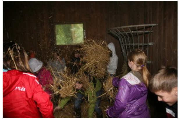
Nach getaner Arbeit gings in die Scheune . . .