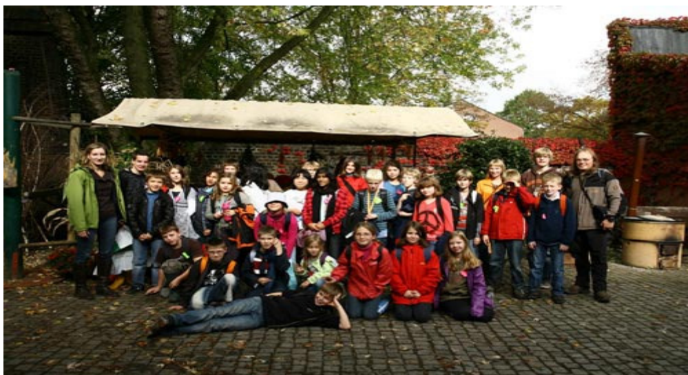
Sicher ist, dass dieser Tag einer der schönsten Tage unserer bisherigen Schulzeit war.