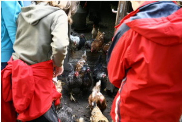
Und dann ging der Stall auch schon auf und die Hühner stürzten heraus