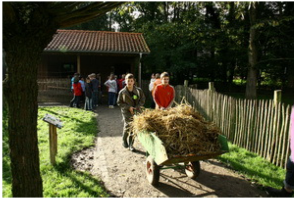
Aber auch wir Schüler hatten keine "Kräfte"-Probleme