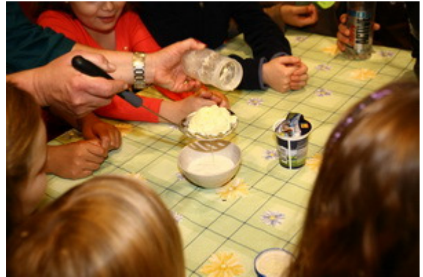
... und jetzt kam die selbstgemachte Butter ins Spiel