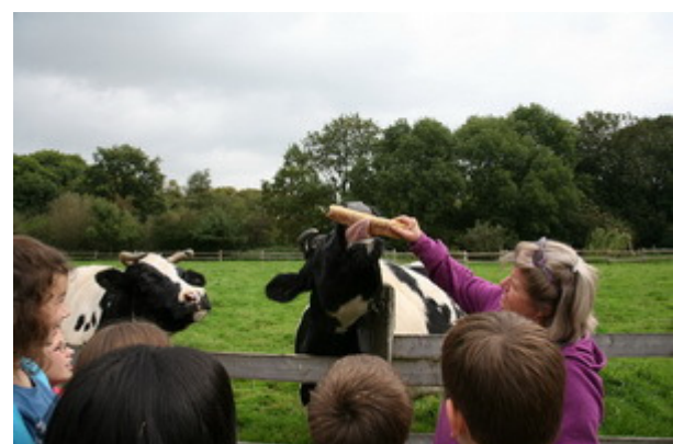
Und sie zeigte uns auch, was ihren Lieblingen so schmeckt