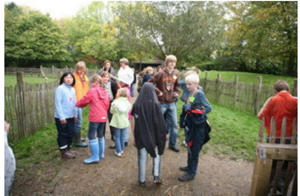
Nachdem wir uns alle Halme aus den Haaren gezupft hatten . . .