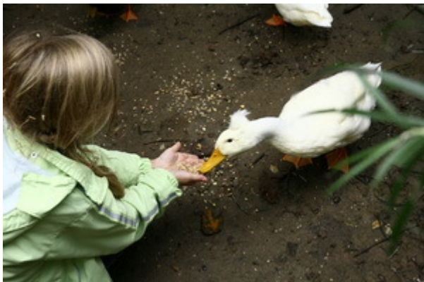
Aber wir hatten keine Berührungängste . . .