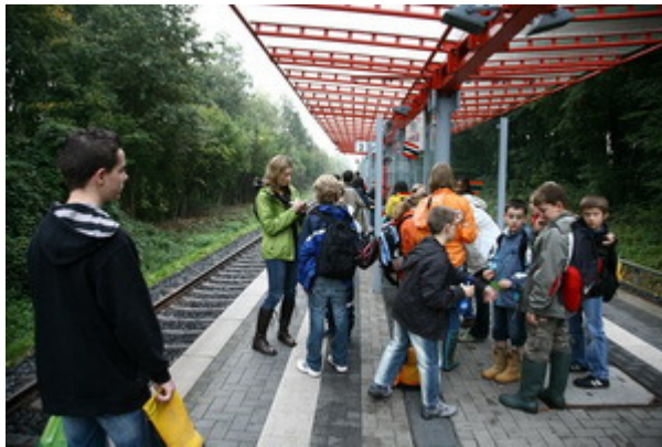
Gestartet sind wir vom S-Bahnhof Kaarster See