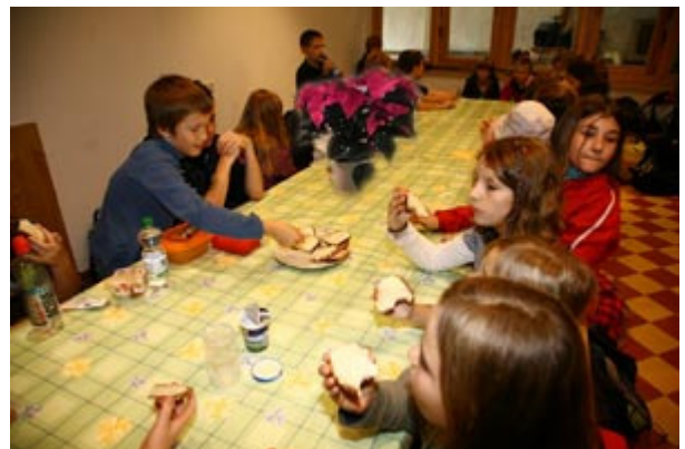
... und schon standen die ersten Verpflegungsteller auf dem Tisch