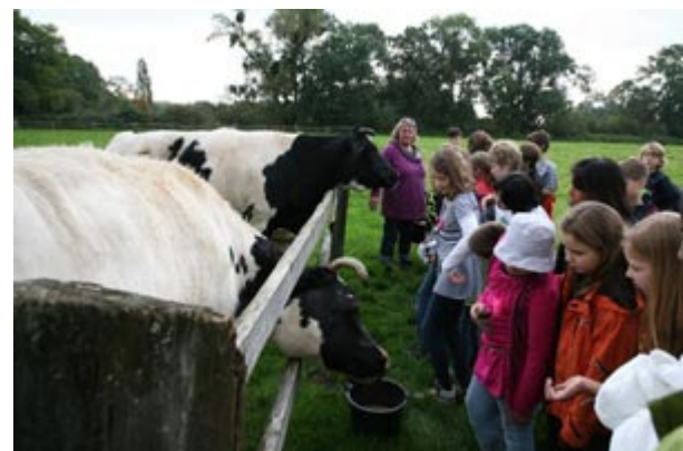
. . . zu den Kühen