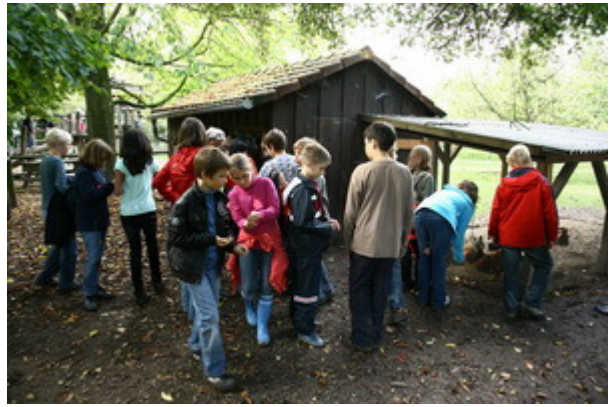
Aber wir hatten schon wieder ein neues "Fütterungsziel" und versorgten uns noch schnell mit Futter