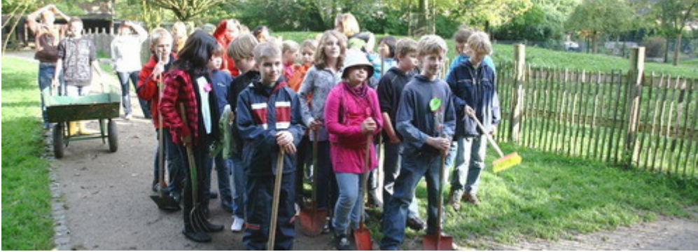
Die Schülerinnen und Schüler der 5b sind gut ausgerüstet für ihren Einsatz auf dem Bauernhof